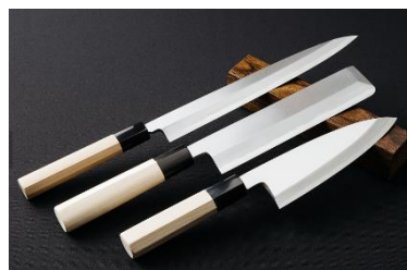
世界が認める堺の包丁