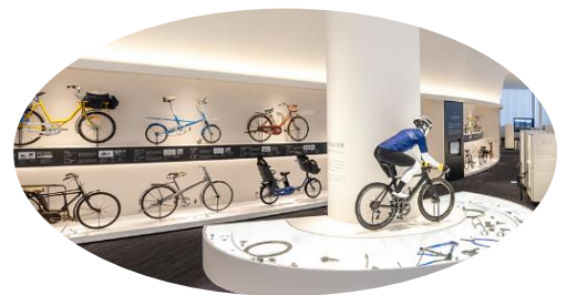
シマノ自転車博物館

特産品としては、「あたり前田のクラッカー」「シマノの自転車」「包丁」「線香」などが有ります。